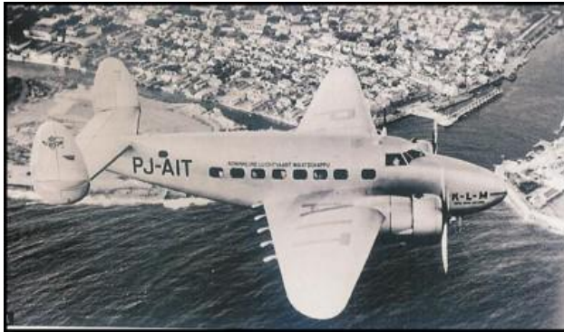
KLM Lockheed boven Curacao

Het enthousiasme van de bevolking van Paramaribo kende geen grenzen want volgens volksoverlevering was Juliana de kleindochter van de Nederlandse koning Willem III welke in de 19e eeuw de slaven had bevrijd. Overigens waren de straten van Paramaribo voorafgaand aan dit bezoek gezuiverd van bedelaars en ongunstig volk, want je weet maar nooit. Na een week van plichtplegingen en een allerhartelijkste ontvangst vlogen prinses en gevolg met de Meeuw terug naar Miami, net als bij de heenvlucht geëscorteerd door twee bommenwerpers.