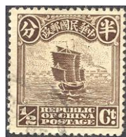
Fig.2 Tweede druk 1916 Peking druk v.a. Mi 148 II