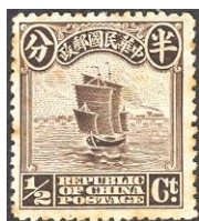
Fig.1 Eerste druk 1913 Londen druk v.a. Mi 148 I