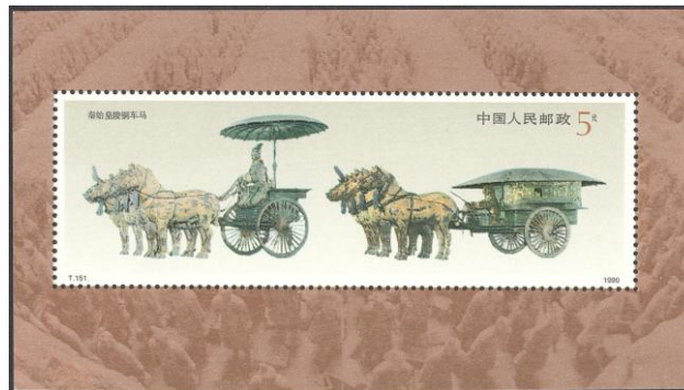
Blok nr 52 1990 ( Michel) fig.1

Toch speelde de waterwegen in grote delen van China een belangrijkere rol, deels omdat de Chinese wegen vaak slecht onderhouden werden.