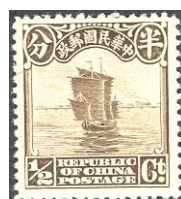
Fig.3 Derde druk 1923-'26 v.a. Mi 187