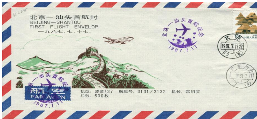
FDC eerste vlucht in 1968, van Beijing naar Shantou

Toen de muur gereed was trok het Keizerrijk zich achter de muur terug, daarbij duizenden kilometers land aan de nomaden prijs gevend. Het zou niet helpen: In 1644 maakten de Manchu gebruik van de interne verdeeldheid en veroverde China.