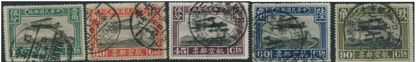
Vliegtuig type Curtiss JN-4, over de grote muur. 2E druk Mi. Nrs. 223-227 (1920)

De Amerikaanse astronaut Leroy Chiao heeft in 2005 fotografisch bewijs geleverd dat de muur wel degelijk te zien is vanuit de ruimte (zei het niet vanaf de maan, maar vanaf het ruimtestation ISS).