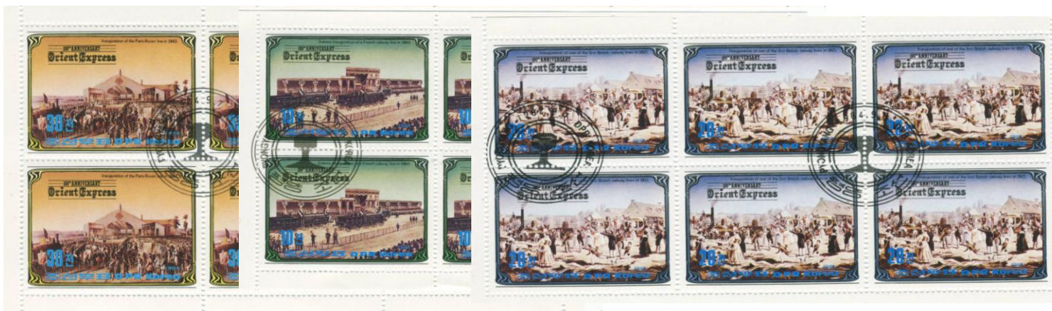
Fig. 4 * 3 velletjes welke speciaal zijn gedrukt t.b.v. 'Filatelisten' die spoorwegzegels verzamelen.

Toen de doorgaande verbinding via Belgrado mogelijk werd ging er twee maal per week van Wenen een aansluitende trein rijden via Boekarest. Op het ogenblik is de zijtak de enige die nog de oorspronkelijke naam Oriënt – Expres”draagt.. Doch alles wat van de oorspronkelijke luxe over is, is één doorgaand slaaprijtuig dat viermaal per week de verbinding Parijs - Boekarest onderhoudt.