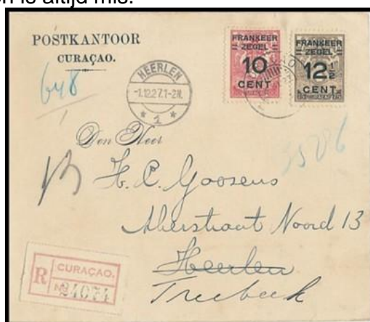
Aanget. FDC(?) oct. 1927 Curaçao met overdrukte brandkastzegels

Na het brandkastzegelfiasco op de Indiëlijn bleven PTT en Van Blaaderen NV in 1923 zitten met een voorraadje brandkastzegels die waren aangemaakt voor Curaçao en Suriname, dus voor gebruik op scheepvaartlijnen naar de West. Gezien het fiasco op de Indiëlijn begon PTT daar niet aan. Die zegels werden dus jaren later door de PTT overgenomen en met waardeopdruk vanaf oktober 1927 opgebruikt in de West als gewone frankeerzegels. Ditmaal lieten de filatelisten zich niet verrassen. De belangstelling van Nederlandse verzamelaars was dusdanig groot dat deze brandkastzegels "Suriname" en "Curaçao" met opdruk "Frankeerzegel" en een frankeerwaarde in een mum van tijd waren uitverkocht. Iedere verzamelaar hoopte dat ze even schaars en duur zouden worden als de "echte" brandkastzegels voor de Indiëlijn. Maar dat gebeurde niet, gezien de veel grotere oplages: 18500 series voor Curaçao en 36000 series voor Suriname, en daar bovenop een hoop extra zegels van lagere waardes. Jammer maar helaas. Ach, je moet ook als filatelist maar denken: nooit geschoten is altijd mis.