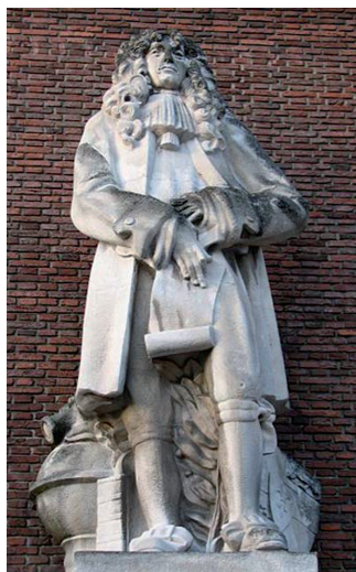
Schiekade in Rotterdam

Luit, Clavesimbel en Viola da Gamba) en praktisch (Op zijn negende bouwde hij een eigen draaibank). Hij studeerde rechten en wiskunde aan de universiteit van Leiden. Via zijn vader kwam hij in