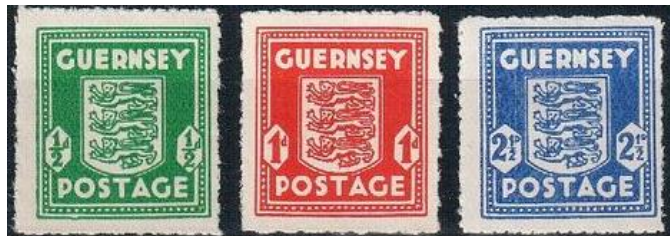
Een door Duitsland bezet Engels gebied, had z'n eigen zegels

Ik heb een ontzettend goeie televisie serie Gezien. Hij werd uitgezonden op 'BBC First', een prima toegevoegde zender, waar heel veel goede detectives en andere verhalen uitgezonden worden met ondertiteling. Die ondertiteling is cruciaal want daardoor gaan de finesses niet verloren! Deze serie is gebaseerd op het boek van Len Deighton 'SS-GB', een fictief verhaal waarin het 'Herr Hitler' wel gelukt is om Engeland te bezetten, nadat hij de 'Battle of Britain' wel had gewonnen en het Verenigd Koninkrijk zou hebben veroverd. Hij zou er ongetwijfeld zijn handen aan vol gehad hebben want zo snel laten die Britten zich natuurlijk niet knechten. Om de opnames zou getrouw mogelijk aan de inhoud van het boek weer te geven heeft men zelfs nazivlaggen aan een gedeeltelijk in puin