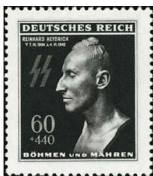
Postzegels voor gebruik in bezette landen, werden

ontworpen conform het idee dat Hitler over dat land had. Alleen landen die volledig in Duitsland opgenomen waren kregen zegels met het opschrift 'Grossdeutsches Reich'. Landen die onder de directe controle stonden, dus eigenlijk als protectoraat werden aangezien, een soort kolonie dus, kregen opschriften die de Duitse bezetting lieten blijken. Bijvoorbeeld Polen, daar had