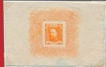
Unieke set stempelproeven