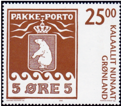
Zegel ter gelegenheid van 100 jaar Pakkeporto-zegels. Uitgegeven in 2005. De oorspronkelijke zegels werden uitgegeven ten behoeve van pakketvervoer tussen Groenland en Denemarken.

vorm van wapens, munitie, hout, gereedschap, enz. Er was geen ankerplaats ten zuiden van Cape York, maar er was een uitstekende haven enkele mijlen ten noorden van de North Star Bay.