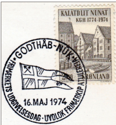
Kungl Grönländska Handeln 100 jaar.

Op 30 mei 1905 berichtte de KGH dat 'mogelijk de oprichting van een handels-en missionaris station op Cape York wordt