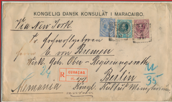
De 1½ gulden is zeer zeldzaam op brief!