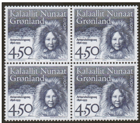
In 1996 werd op een EUROPA zegel een bekende vrouw afgebeeld, die had deelgenomen aan de vijfde Thule expeditie, ‘De grote slee tocht’. De vrouw Arnarulunnguaq, had een belangrijke rol bij de expeditie om verschillende redenen.