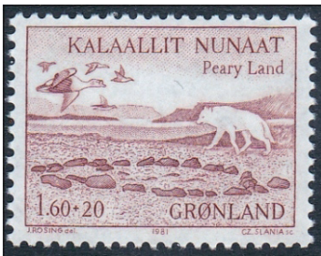
Peary Land. Zegel uit 1981

Het was een zware reis die eindigde met een langdurig verblijf met ziekte, honger en ellende. Maar ook met goede mensen die hun schamele voorraden in grote gastvrijheid deelden en zorg toonden, vooral naar de meest kwetsbare leden van de expeditie.