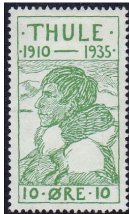
Zegel uit 1935

van inuk, dat 'mens' of 'echte mens' betekent.)