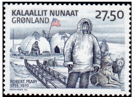
Zegel en blokje Robert Peary 2005

De Polar Inuit deelden niet de belangstelling van hun bezoekers voor de onherberg-