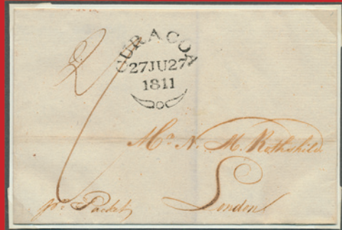
Engelse bezetting van Curaçao: Brief naar Londen met het zeldzame fleuron-stempel!