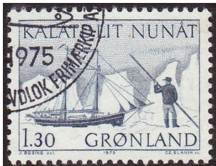
De schoenen Søkongen . Zegel uit 1975.

Het station moest een handels- en onder-