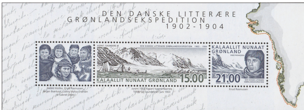
Deense literaire expeditie 1902-1904. Blokje uit 2004